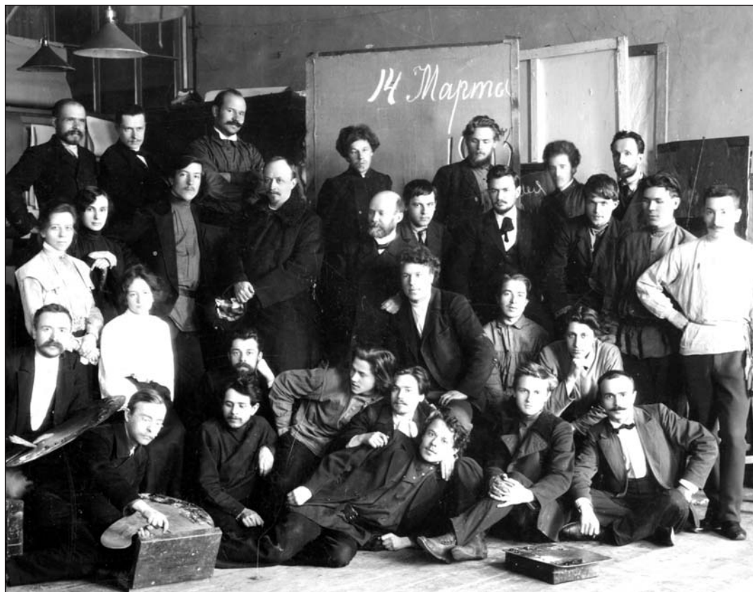
Члены Товарищества художников-передвижников.

младшего поколения передвижников, академик, народный художник РСФСР, первым получивший это звание в 1923 году.