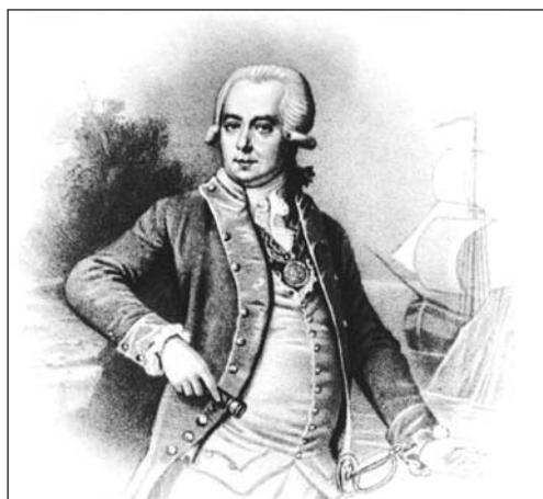
Г.И. Шелихов 2

бург, и Шелихов был вызван в столицу. К нему благосклонно отнеслась царица Екатерина II, ему было предложено снарядить две экспедиции на дальний Восток, а сам Шелихов был награждён алмазами, шпагой и грамотой, позволявшей продолжить начатую деятельность по освоению новых территорий.