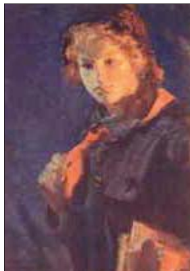
Худож. Н.А. Касаткин. «Пионерка с книгами». 1926 г.

Главная цель нашей работы в том, чтобы в ряду самых известных художников XIX — начала XX века всегда оставалось имя «последнего знаменосца передвижничества» художника и педагога Николая Алексеевича Касаткина.