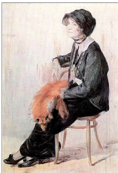
Худож. Н.А. Касаткин. «Женский портрет»