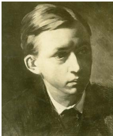
Н.А. Касаткин. Портрет работы В.Г. Перова. 1880 г.

Наши изыскания продолжались два года. Сначала, в 2009 году, мы изучили публикации, посвященные Н.А. Касаткину, и репродукции его картин. Они дали нам первоначальные представления о личности этого человека. Мы узнали о том, как велико его творческое наследие. Картины художника хранятся в Третьяковке (15 картин и эскизы), в Государственном центральном музее современной истории России (36 картин), а также в галереях других городов России и частных коллекциях.