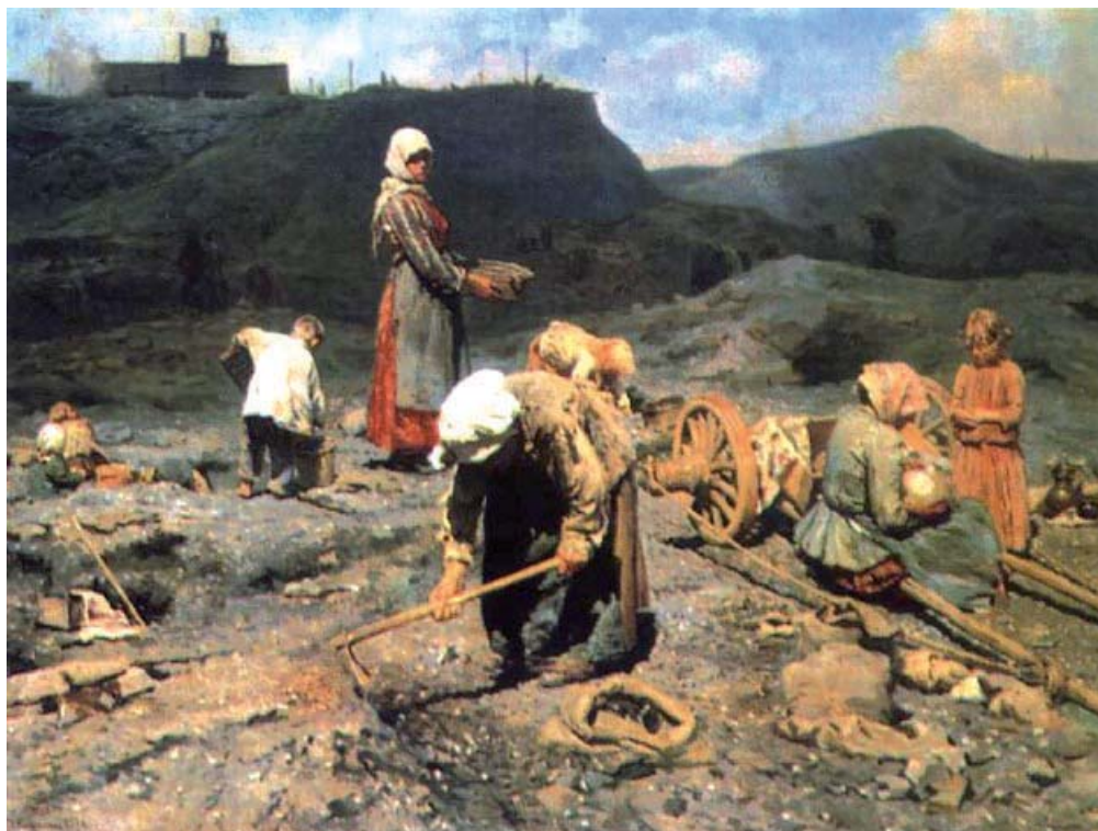
Худож. Н.А. Касаткин. «Сбор угля бедными на выработанной шахте». 1894 г.

Летом Николай Алексеевич перебрался на дачу в Ростокинском проезде в Сокольниках, проезд является продолжением улицы, названной в 1966 году улицей Касаткина (Алексеевский район Москвы). Здесь он жил и одновременно работал. Из архивных данных мы узнали, что в 20-е годы, живя здесь, Касаткин преподавал детям рисование и на Станции юннатов, которая соседствовала с дачей художника (сгоревшей 10 лет назад), и в Лесной школе в Сокольниках, и в санатории «Захарьино», находившемся там же (сейчас — санаторий «Сокольники»).