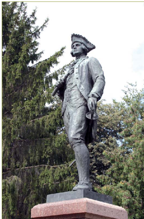
Памятник Г.И. Шелихову в Рыльске

безвестны». Средства на памятник были собраны путём всероссийской подписки.