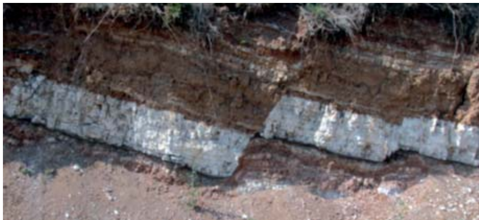
Фрагмент обнажения наклонно залегающих слоёв, разбитых разломами, у с. Безводного на Волге

низким левобережным волжским берегам — здесь чувствуешь счастье быть русским, россиянином, волгарём. Здесь осознаёшь себя частичкой, как это представляет известный нижегородский учёный О.В. Трошин (2009, с. 20–21), центра «топологической культурно-экологической микросистемы Центрально-русского духовно-генетического и нравственного генератора евразийской культуры», возраст которой уходит в глубь веков за 4-е тысячелетие до н.э.; осознаёшь себя принадлежащим большой группе индоевропейских народов, патриотом России.