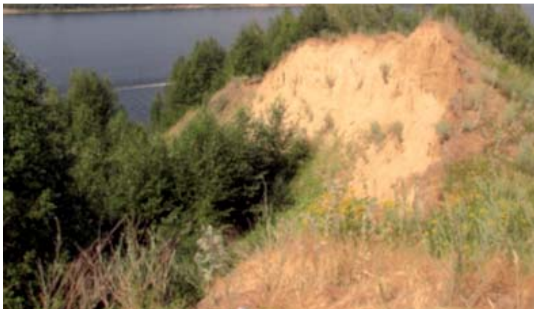
Оползень на Волжском откосе

ском карьере в 2003 году наши предшественники, члены Нижегородского учебного детско-юношеского геологического центра «Самоцветы» (Рубцов и др., 2005), открыли и сделали первое описание Болотниковской пещеры, населённой летучими мышами. Как оказалось позднее, длина этой пещеры составляла 72 м. Мы также хотели познакомиться с этой пещерой, но, к сожалению, вход в неё теперь завален.