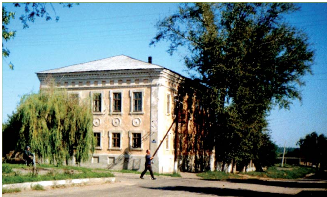
Дом, где родился Г.И. Шелихов

Физически крепкий, жадный до знаний, не ведающий страха перед будущим, Григорий Шелихов в 1773 году покидает отчий дом и едет в да-