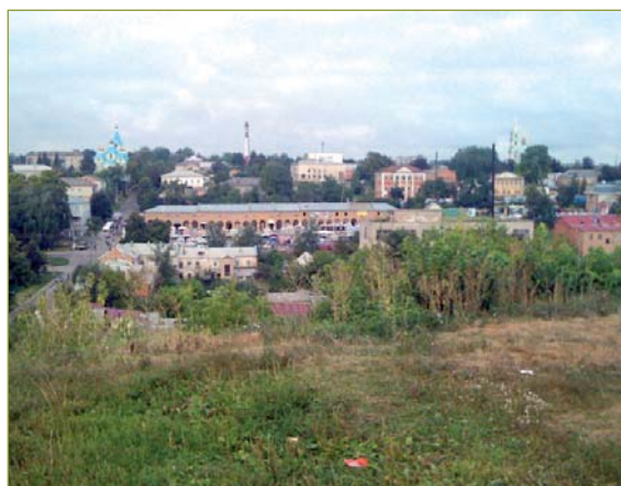
Вид на город с горы Ивана Рыльского