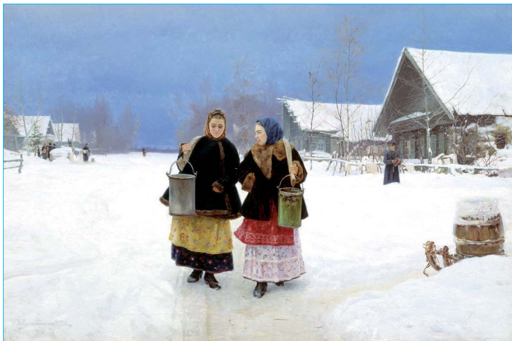
Худож. Н.А. Касаткин. «Соперницы». 1880 г.