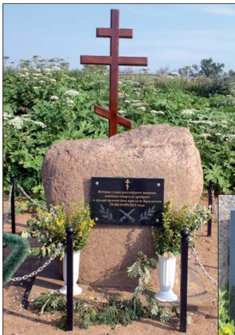
Памятный знак в селе Крымском.