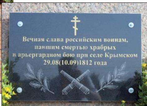
2011 г.