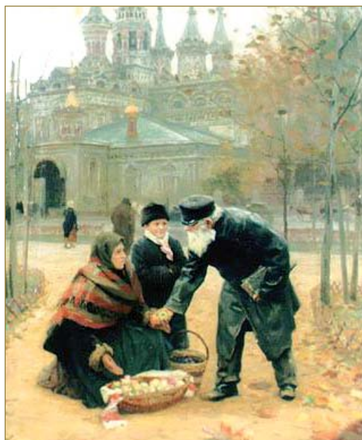
Худож. Н.А. Касаткин. «Добрый дедушка». 1899 г.

10. Соловьева Ю.Н. Сокольники. 6-й Лучевой просек, д. 21. — М., 2000.