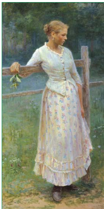
Худож. Н.А. Касаткин. «Девушка у изгороди». 1893 г.