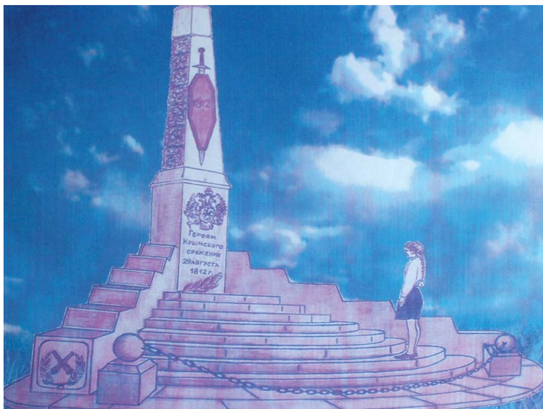
Эскиз будущего памятника. Рисунок П.Ф. Капустина