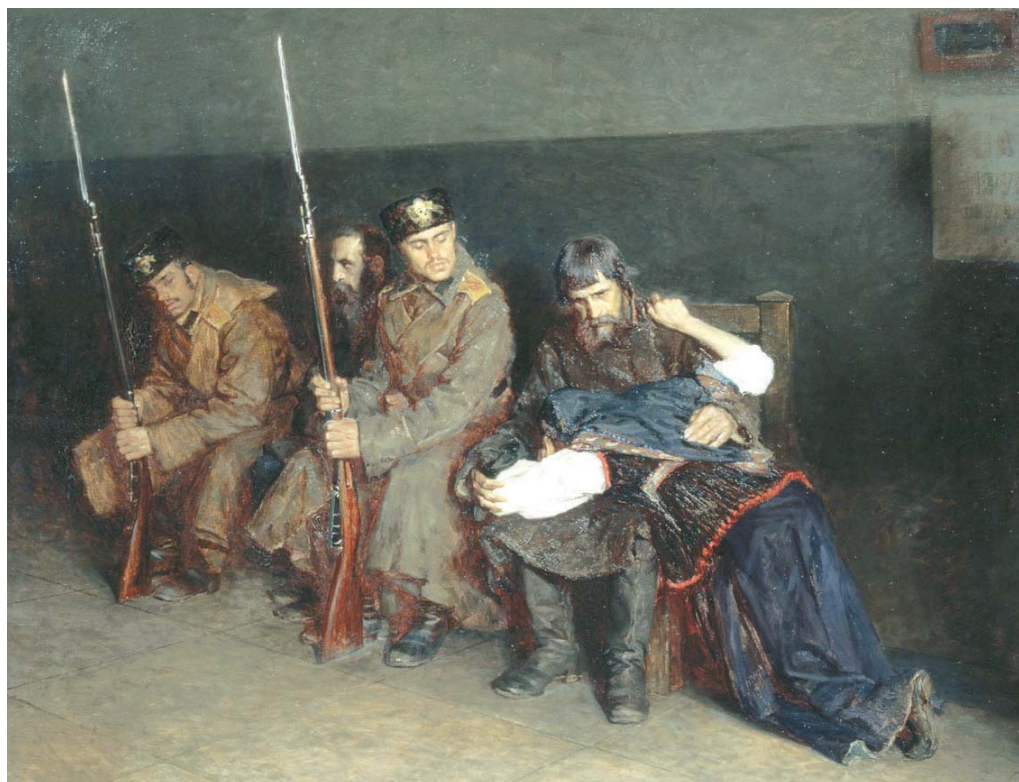
Худож. Н.А. Касаткин. «В коридоре окружного суда». 1897 г.

крылась 14 декабря 2010 года в филиале ГЦМСИР, в музее «Подпольная типография 1905–1906 гг.». Мы присутствовали на ее открытии, выступали с театральной композицией. Большим событием для нас стало знакомство с полотнами Николая Алексеевича на этой выставке, так как сейчас все его картины в записниках.